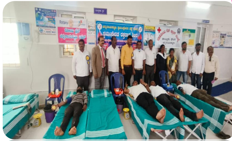
A blood donation camp and baby shower function were organized at PHC Bagevalu, attended by the DHO and RCH officer, highlighting community health initiatives. These events encourage blood donation and celebrate new arrivals.