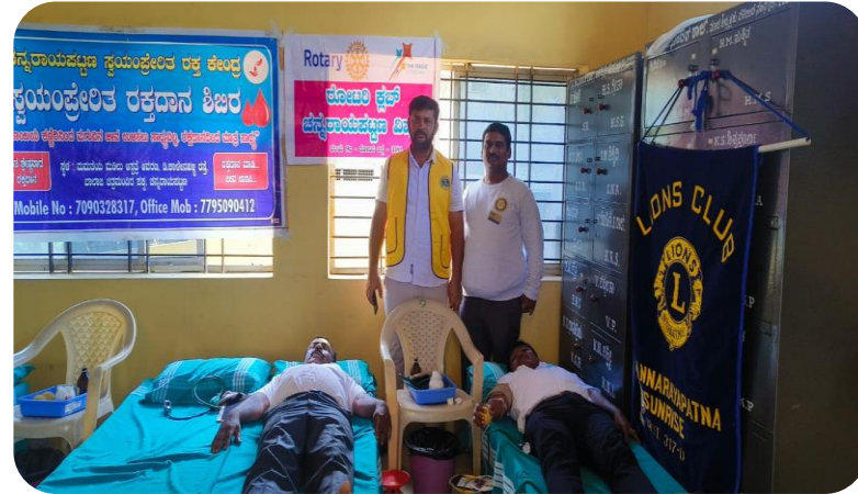
A blood donation drive was successfully organized at Naukarara Bhavana, Gandhi Circle, and Manjanahalli in Channarayapatna. The event witnessed an overwhelming response, highlighting the community's commitment to saving lives.