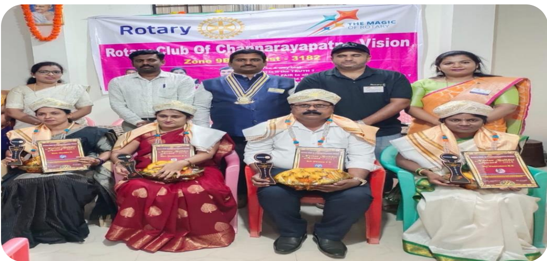
The Nation Builder Awards were facilitated to honor outstanding teachers in Channarayana as part of Teachers' Day celebrations. This event recognized the significant contributions of educators in shaping the future of students and the community.