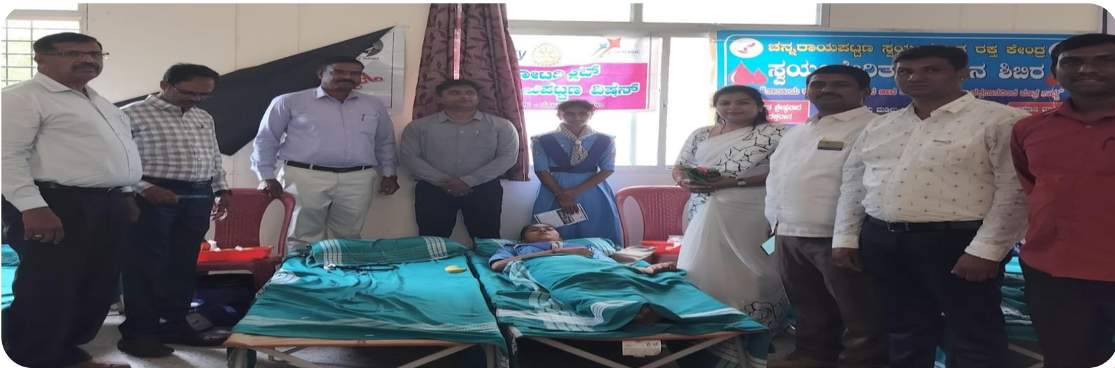
A blood donation camp was organized at the Government First Grade College in Udayapura, and first aid kits were donated to the college. These initiatives aim to promote health and safety within the campus community.